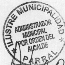
ISRAEL URRUTIA ESCOBAR ALCALDE DE PARRAL