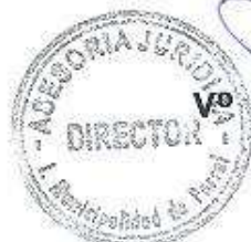
Bº Asesor Jurídico