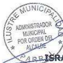
ISRAEL URRUTIA ESCOBAR Alcalde de Parral