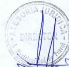
Vº Bº Asesor Jurídico