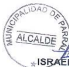
* ISRAEL ÚRRUTIA ESCOBAR ALCALDE DE PARRAL

ANOTESE, REFRENDESE, COMUNIQUESE Y CUMPLASE.