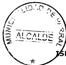
ISRAEL URRUTIA ESCOBAR ALCALDE DE PARRAL