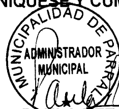
PAULA RETAMAL URRUTIA ALCALDESA DE PARRAL

[Handwritten signature] PRU/ARC/MSM/DI Finvif DISTRIBUCIÓN 1.- I. Municipalidad de Parral 2.- Archivo Finanzas 3.- Interesado 4.- Archivo