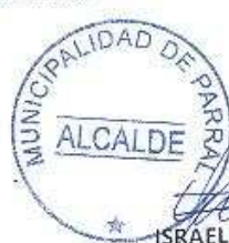
ISRAEL URRUTIA ESCOBAR ALCALDE DE PARRAL