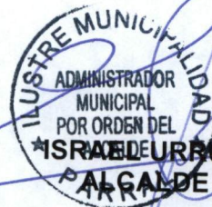
ISRAEL DURÁN ESCOBAR ALCALDE DE PARRAL