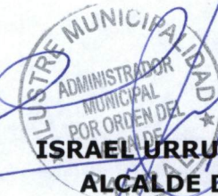
ISRAEL URRUTIA ESCOBAR ALCALDE DE PARRAL