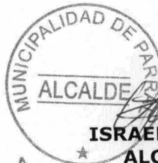
ISRAEL URRUTIA ESCOBAR ALCALDE DE PARRAL