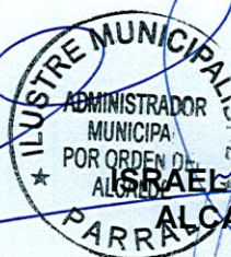
ISRAEL URRUTIA ESCOBAR ALCALDE DE PARRAL