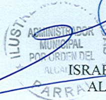
ISRAEL URRUTIA ESCOBAR ALCALDE DE PARRAL