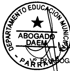
ABOGADO DAEM PARRAL