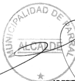
Israel Urrutia Escobar ALCALDE