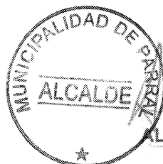
ALEJANDRA ROMÁN CLAVIJO ALCALDE DE PARRAL (S)