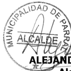
ALEJANDRA ROMAN CLAVIJO Alcalde de Parral(s)