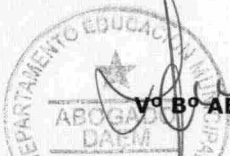
Vº Bº ABOGADO DAEM.-