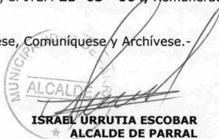
ISRAEL URRUTIA ESCOBAR ALCALDE DE PARRAL