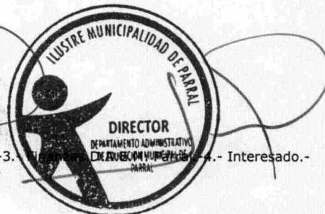
DIRECTOR DEPARTAMENTO ADMINISTRATIVO DE EDUCACION MUNICIPAL PARRAL