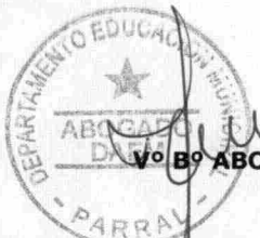
N° B° ABOGADO DAEM.-