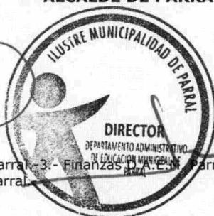
DIRECTOR DEPARTAMENTO ADMINISTRATIVO DE EDUCACIÓN MUNICIPAL PARRAL