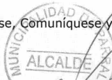
ISRAEL URRUTIA ESCOBAR ALCALDE DE PARRAL