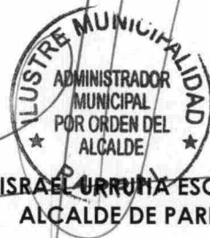
ISRAEL URRUTIA ESCOBAR ALCALDE DE PARRAL