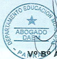
N° 8° ABOGADO DAEM