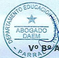
Vº Bº ABOGADO DAEM